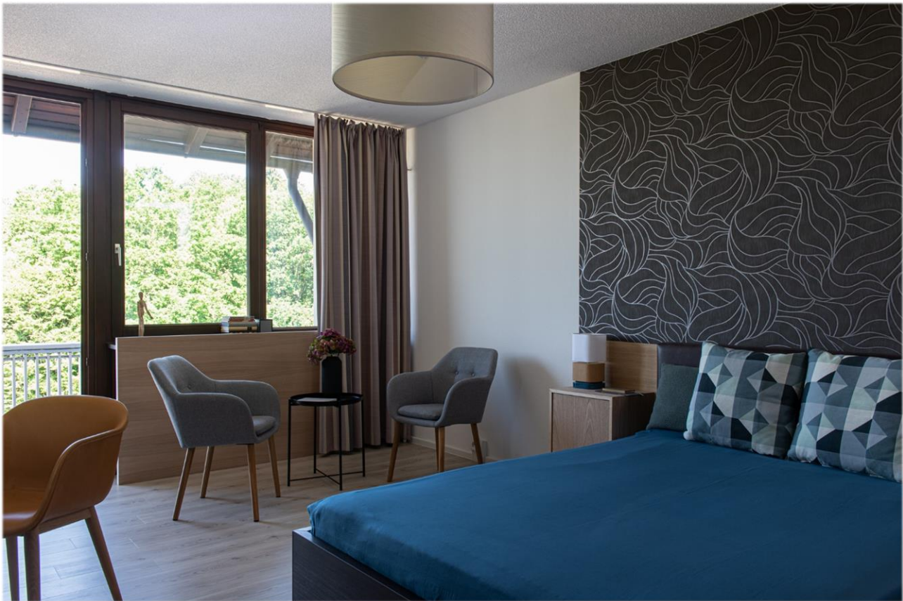
Patientenzimmer mit Wohlfühlatmosphäre.