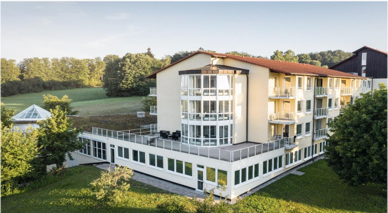
Oberberg Fachklinik Rhein-Jura.

Gelegen in einer der schönsten Regionen Europas ist die Oberberg Fachklinik Rhein-Jura eine private Akutklinik für Psychiatrie, Psychosomatik und Psychotherapie. Sie verfügt nicht nur über eine ärztliche Behandlung auf höchstem Niveau, sondern ist auch ein Ort, der Raum zu Selbstbesinnung, Neuorientierung und zur Heilung bietet. Das allgemeine Behandlungskonzept der Oberberg Kliniken basiert auf einem ganzheitlichen Menschenbild. Bei der Diagnostik werden neben den körperlichen und seelischen Symptomen auch die gesamte Person mit ihrer Biografie, ihrer Persönlichkeit und ihrem sozialen Umfeld betrachtet. Dabei wird stets auf dem neuesten Stand der Wissenschaft gearbeitet und in einer Atmosphäre, in der sich die Patienten wohl- und geborgen fühlen. Um bestmögliche Therapieergebnisse zu erreichen und den höchsten Qualitätsansprüchen gerecht zu werden, erfolgt die Behandlung der Patienten nach einem verbindlichen Prinzip: innovativ, intensiv und individuell.